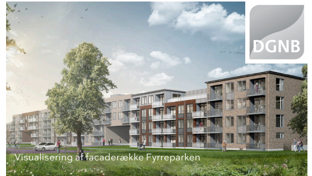
Visualisering af facaderække Fyrreparken