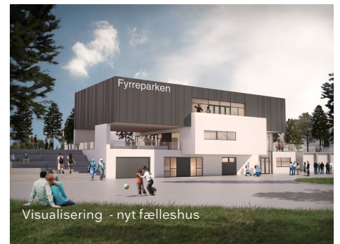
Visualisering - nyt fælleshus